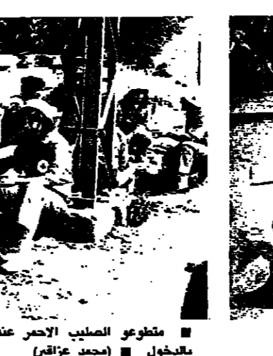
مسلحون في منطقة مخيم برج البراجنة